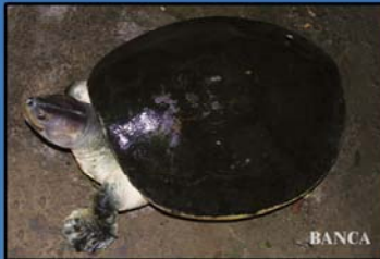
Batagur trivittata (Myanmar Roofed Turtle) IUCN (2013) - Endangered CITES(2013) - Appendix II MWL (1994) - Protected MFL (1993) - Protected Distribution - Formerly Ayeyarwady, Chindwin and Sittoung rivers, including larger tributaries. Now, rarely found Chindwin river (Sagaing Region) and Dokhtawady river (Mandalay Region)