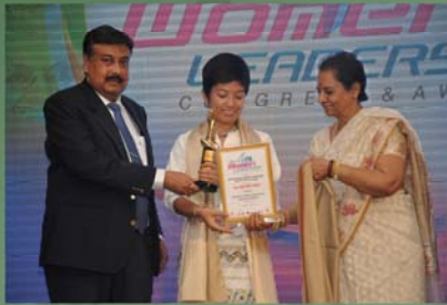
Chairperson received 'Outstanding Women Leadership Achievement Award'