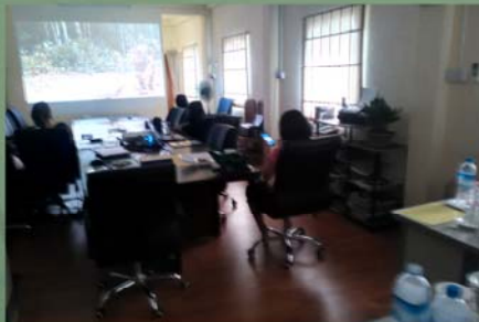
22.3.2014 Pilot Saturday Event, BANCA office (Every Saturday - 2:00 PM)