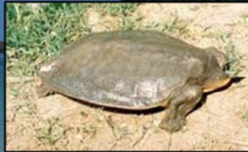
Chitra vandijkii (Myanmar Narrow-headed Softshell Turtle) IUCN (2012) - Critically Endangered CITES(2013) - Appendix I MWL (1994) - Protected MFL (1993) - Protected Distribution - Ayeyarwady Region, Bago Region, Kachin State, Magwe Region, Mandalay Region, Mon State, Sagaing Region and Shan State.