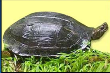
Melanochelys trijuga edeniiana (Myanmar Black Turtle) IUCN (2013) - Nearly Threatened CITES(2013) - Appendix II MWL (1994) - Protected MFL (1993) - Protected Distribution - Bago Region, Kachin State, Magwe Region, Mandalay Region, Sagaing Region and Shan State.

(မြန်မာနိုင်ငံ တွင်တွေ့ရသော မြန်မာ့ဒေသရင်း လိပ် မျိုးစိတ်များ)