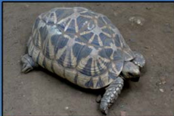
Geochelone platynota (Myanmar Star Tortoise) IUCN (2013) - Critically Endangered CITES(2013) - Appendix I MWL (1994) - Protected Distribution - Magwe Region, Mandalay Region and Sagaing Region