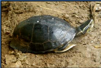
Cuora amboinensis lineata (Myanmar Box Turtle) IUCN (2013) - Vulnerable CITES(2013) - Appendix II MWL (1994) - Protected MFL (1993) - Protected Distribution - Kachin State, Kayah State, Kayin State, Mon State, Shan State and Tanintharyi Region.