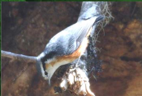
White - browed Nuthatch Sitta victoria (မျက်ခုံးဖြူငှက်ဖြာခြောက်)

Distribution - South, Central and North Myanmar. It is commonly found below 900 Meters. i.e Bago, Magwe, Sagaing divisions and Kachin state. Status - common