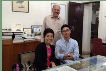
15.2.2014 Meeting with Bombay Natural History Society(BNAS)Mumbai,India