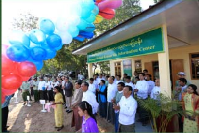
22.2014 World Wetlands Day at Moeyungyi Ramsar site Wetland Sanctuary