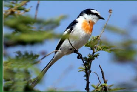
White - bellied Minivet (ငှက်မင်းသားဝမ်းဖြူ)

Distribution - Central and South Myanmar. It is commonly found below 1200 feet. i.e Yangon, Bago, Mandalay, Magwe and lower Sagaing divisions. Status - Common