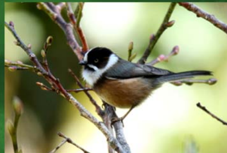
Burmese Tit (မြန်မာတစ်ငှက်)

Distribution - Mt. Victoria (Natmataung) of Southern Chin State at elevation above 8000ft. Not even found in Central Chin. Status - Locally uncommon to Rare