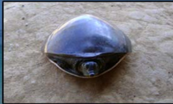
Lissemys scutata (Myanmar Flapshell Turtle) IUCN (2013) - Data Deficient CITES(2013) - Appendix II MWL (1994) - Protected MFL (1993) - Protected Distribution - Throughout in Myanmar