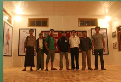
24.1.2014 Preparation of Moeyungyi Education Center for World WetLand Day