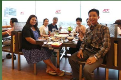
17.3.2014 Meeting with Thai Wetland Foundation, Bangkok, Thailand