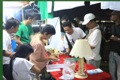
31.1.2014 CSO Funfair at Pyi Thu Oo Yin (Thanks to Action Times Foundation)