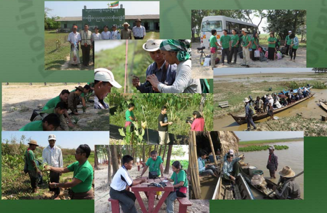
24.2.2014 to 2.3.2014 - Moeyungyi Field Survey (Rapid Assessment)