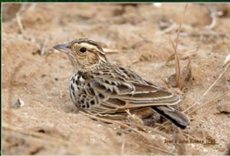
Burmese Bushlark (Myanmar Bushlark) (မြန်မာဘီလုံး)

Distribution - Central and South Myanmar. i.e Mandalay, Magwe and lower Sagaing Divisions. Status - Rare