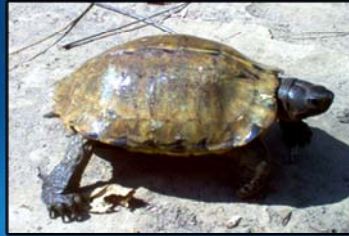
Heosemys depressa (Rakhine Forest Turtle) IUCN (2013) - Critically Endangered CITES(2013) - Appendix II MWL (1994) - Protected MFL (1993) - Protected Distribution - Rakhine State and Western Ayeyarwady Region.