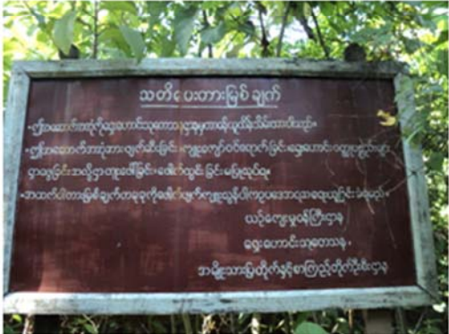
မုတ္တမပင်လယ်ကွေ့အတွင်း အရှေ့ဘက်ကမ်းဘီးလင်းမြို့နယ်ရှိ ဝင်းကမြို့ရိုးဟောင်း