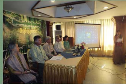
11.1.2014 Bamboo Lover Gathering meeting at Orchid Hotel