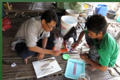
29.3.2014 Gulf of Martaban field survey (fishery survey)