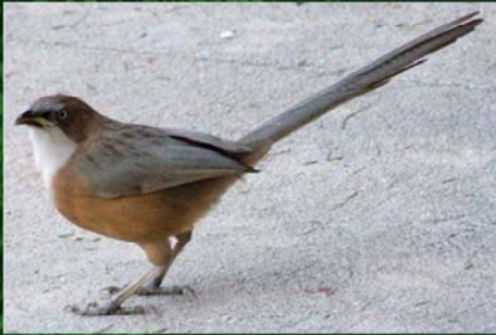
White - throated Babbler (ဝေ့.)

(မြန်မာနိုင်ငံ၌သာတွေ့ရသည့် မြန်မာ့ဒေသရင်း ငှက်မျိုးစိတ်များ)