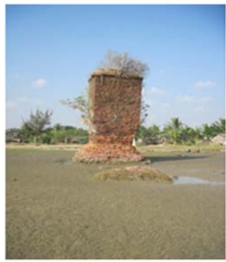
မုတ္တမပင်လယ်ကွေ့အတွင်း အနောက်ဘက်ကမ်းရှိ မီးပြတိုက်ဟောင်းနှင့် မြို့ရိုးဟောင်း