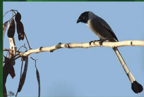
Hooded Treepie (နုစားကြိုး)

Distribution - South and Central Myanmar. i.e Bago, Mandalay, Magwe and lower Sagaing Divisions. Status - common.