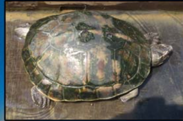
Morenia ocellata (Myanmar Eyed Tortoise) IUCN (2013) - Vulnerable CITES(2013) - Appendix I MWL (1994) - Protected MFL (1993) - Protected Distribution - Throughout except at high elevation