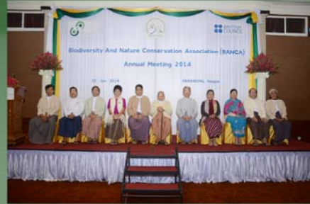
10.1.2014 BANCA annual meeting at Park Royal Hotel